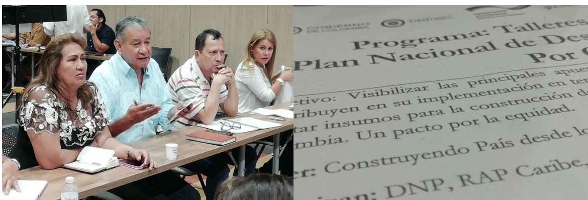
Taller Regional DNP Orinoquia. Yopal 10 de Octubre 2018

En este espacio, los y las delegados de las mesas departamentales de participación efectiva de víctimas asistieron a los talleres convocados por el DNP para participar de la identificación de apuestas estratégicas y del trabajo de priorización de iniciativas regionales, visibilizando la importancia que tiene el tema de víctimas para el desarrollo y competitividad de la región.