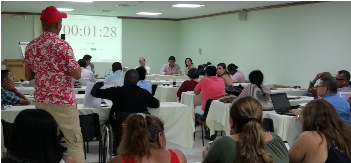
Mesa de Naiconal de coordinadores. Santa Marta Septiembre 2018

Esta estrategia resulta de la solicitud de los representantes y delegados de las víctimas del conflicto armado ante la Unidad para las Víctimas, con el fin de que sus recomendaciones y propuestas sean tenidas en cuentas dentro del proceso de construcción de las bases del Plan Nacional de Desarrollo 2018-2022. Para lograrlo, se llevaron a cabo tres momentos: