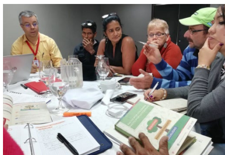
Taller UARIV Antioquia. Medellín 23 de septiembre 2018

Este espacio, en el que participaron profesionales de la Unidad para las Víctimas del nivel nacional y departamental, los participantes tuvimos la oportunidad de conversar con las instituciones y entender la forma en que se estaba construyendo el Plan, así como definimos algunas iniciativas y propuestas con criterios de redacción, buscando siempre la mejor armonía con las apuestas estratégicas de nuestras regiones, así como con los capítulos del Plan Nacional de Desarrollo que se iban actualizando constantemente por parte del Departamento Nacional de Planeación.