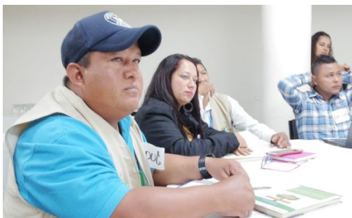
Taller UARIV Pacífico. Cali 23 de Octubre 2018

Finalmente, quienes fuimos delegados para presentar las propuestas ante las entidades del Sistema Nacional de Atención y Reparación Integral a Víctimas (SNARIV), tuvimos que tomar decisiones frente a cómo hacer más pertinente el contenido de este documento, cómo presentarlo de manera estratégica para que nuestras propuestas fueran tenidas en cuenta y como llevar al territorio estos contenidos para conocimiento de todos los interesados.