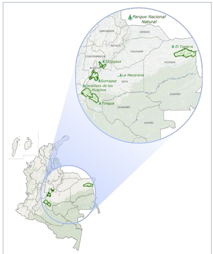
Mapa 1. Ubicación de los PNN de la Región Orinoquía