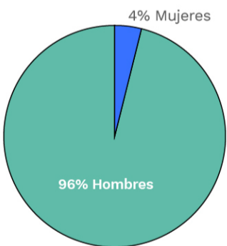
Gráfica 2. Víctimas directas de homicidio por género.

Del total de víctimas directas incluidas por homicidio, 24 eran hombres y 1 era mujer.