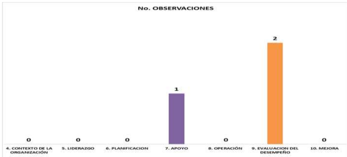
Gráfica No. 2 Porcentaje por numeral de las observaciones de la Norma ISO 45001:2018