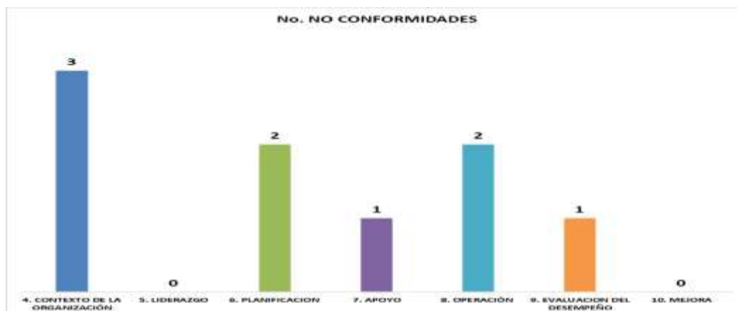
Gráfica No. 2 Número de NC