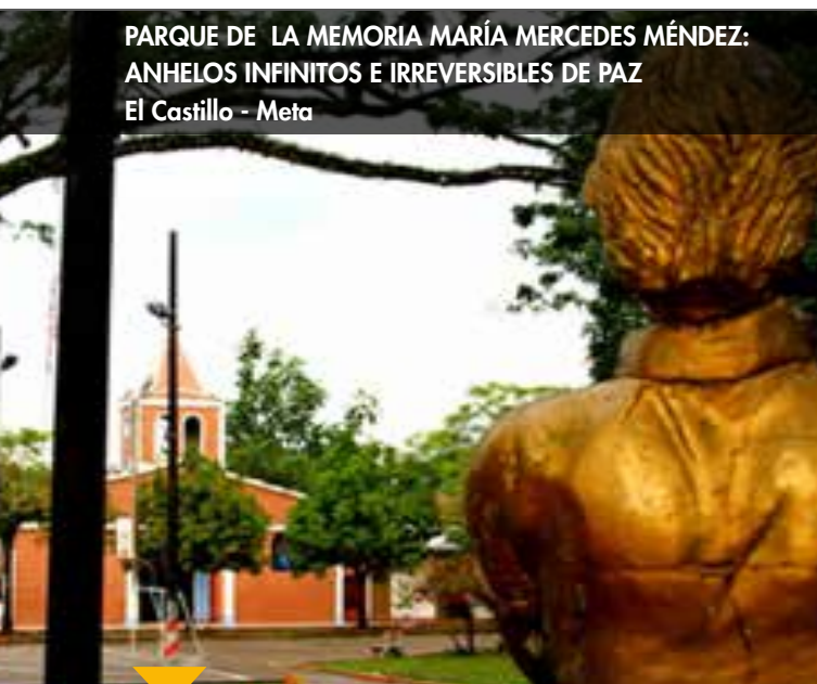
PARQUE DE LA MEMORIA MARÍA MERCEDES MÉNDEZ: ANHELOS INFINITOS E IRREVERSIBLES DE PAZ El Castillo - Meta

Como ejemplo de proceso de construcción física tenemos: