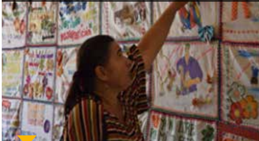
Pueblo Bello, Atioquia