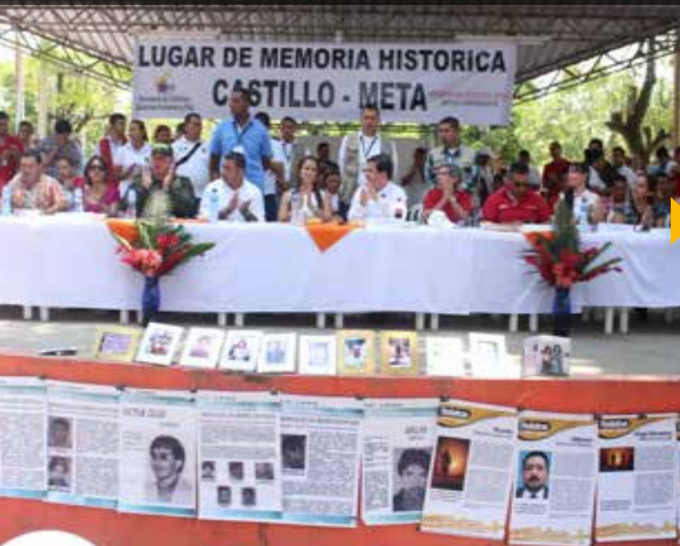
PARQUE DE MEMORIA DEPARTAMENTAL DEL META Villavicencio – Meta

La Gobernación del Meta y las comunidades se encuentran en el proceso de construcción de mínimos sociales, es decir, identificación de: objetivos generales, procesos de memoria, requerimientos de la infraestructura física, características generales que poseerá el lugar etc.