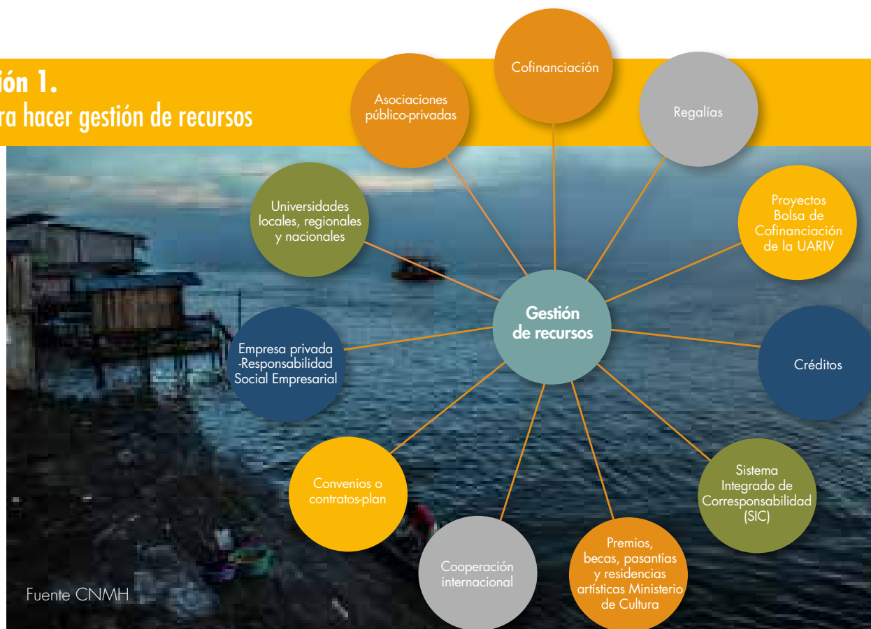
Ilustración 1. Mapa para hacer gestión de recursos

hasta luego de su construcción o adecuación física, y durante todo el periodo de funcionamiento del Lugar de Memoria, y de forma permanente, según las diversas necesidades que se van presentando. Además de los recursos propios, las entidades territoriales pueden contemplar otras estrategias para consolidar el desarrollo de proyectos de memoria histórica. A continuación se presenta un mapa de posibles fuentes de financiación a las que pueden acudir los promotores de Lugares de Memoria en el país para sacar adelante su iniciativa y darle sostenibilidad en el tiempo (Centro Nacional de Memoria Histórica, 2014).