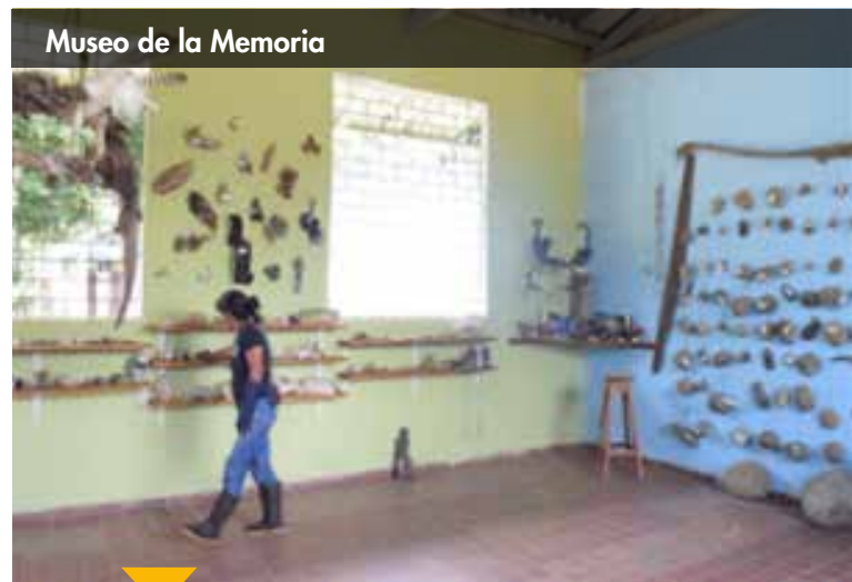
Museo de la Memoria

La normativa creada de manera específica para los entes nacionales tiene como finalidad generar un marco para aquellas entidades que tienen mayor capacidad y cobertura, y que por ser nacionales, no requieren de normativas específicas como sucede con los departamentos, distritos y municipios.