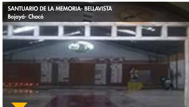
SANTUARIO DE LA MEMORIA- BELLAVISTA Bojayá- Chocó

Como ejemplo de proceso de adecuación tenemos: