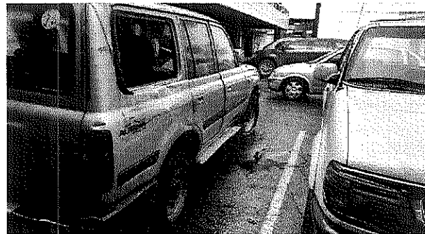
VISTA EXTERIOR TRASERA IZQ.