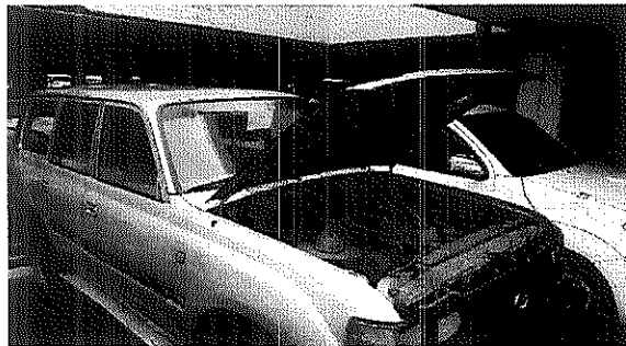
VISTA EXTERIOR TRASERA DER.