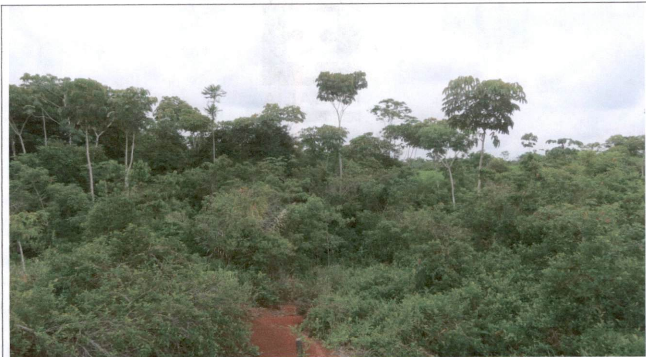
Imagen No.1: predio EL PALOMAR, donde se aprecia el estado y la vegetación frondosa.