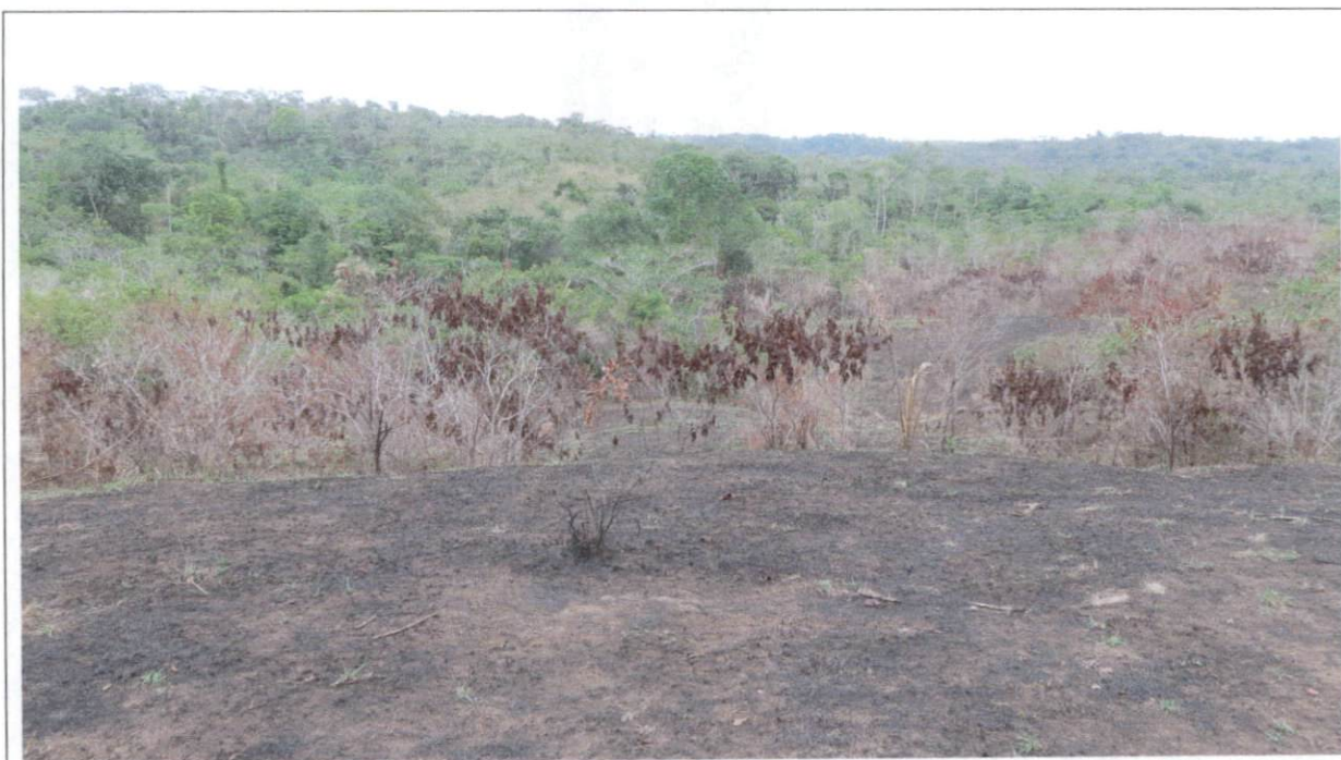
Imagen 1: Zonas de pastos nativos y rastrojo consumidos por el fuego.