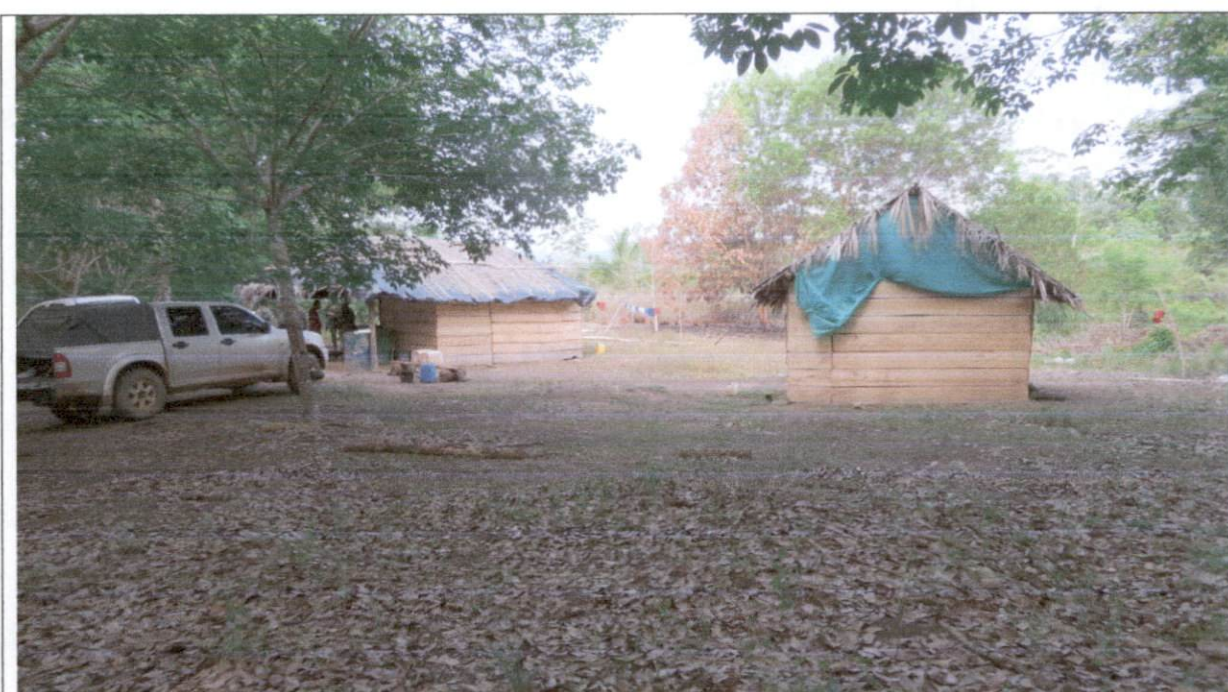
Imagen 3. Construcción artesanal habita por el señor Faiber Florez.