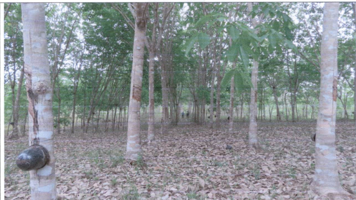
Imagen 2. Cultivo de caucho. Zona en producción.