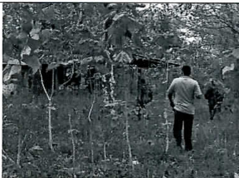
Entrada Casa Principal