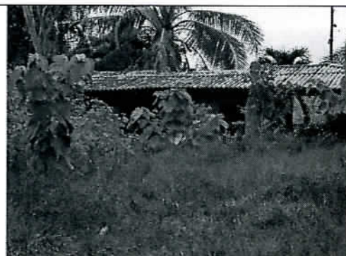
Frente de la Casa