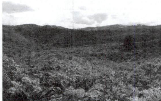
VISTA AEREA GOOGLE EARTH